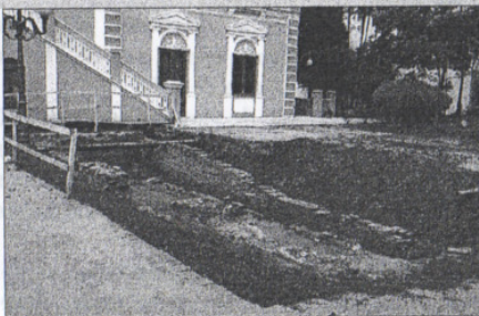
Jardins do Palácio Cruz e Sousa que serão refeitos pelo Governo do Estado após reclamação do IHGSC ao Ministério Público.

O referido Termo de Ajustamento de Conduta, resultou de audiências realizadas perante a Promotoria com o Instituto e representação do Governo do Esta-