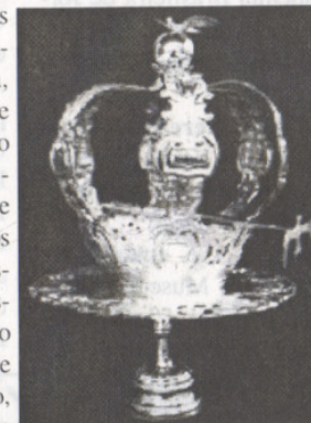
Salva, Coroa e Cetro dos Impérios do Divino

Universidade Federal de Santa Catarina, Instituto Histórico e Geográfico de Santa Catarina, Governo da Região Autônoma dos Açores, Governo do Estado de Santa Catarina, Prefeitura Municipal de Florianópolis, Consulado de Portugal em Florianópolis e Arquidiocese de Florianópolis são os promotores do I Congresso Internacional das Festas do Divino Espírito Santo, que se realizará de 19 a 23 de maio próximo, no Auditório da Reitoria da UFSC.