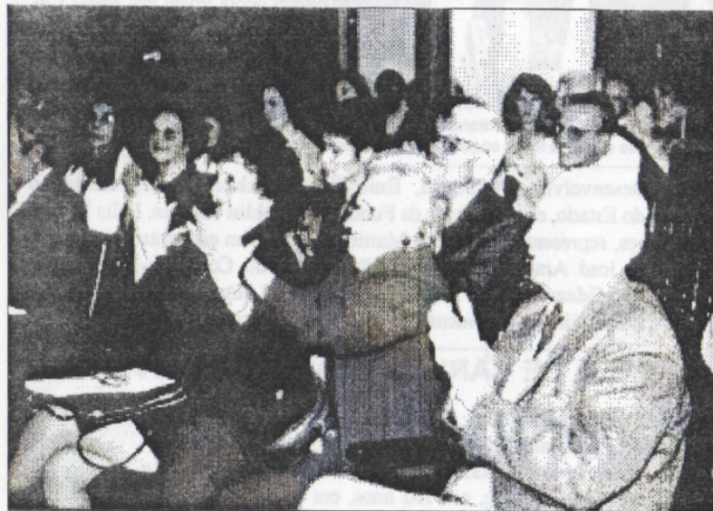
Aspecto do público que compareceu à Sessão Especial do IHGSC em homenagem ao Centenário da Morte do poeta Cruz e Sousa

O centenário da morte do poeta catarinense João da Cruz e Sousa foi assinalado pelo IHGSC em sessão especial, realizada em 20 de maio passado.