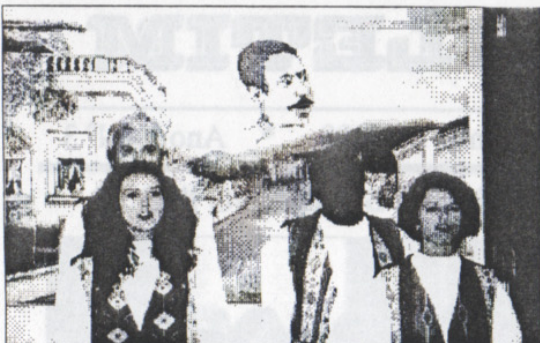
O Grupo de Teatro ARMAÇÃO dramatizou com poesias e peças em prosa do poeta feitas enquanto viveu em Desterro