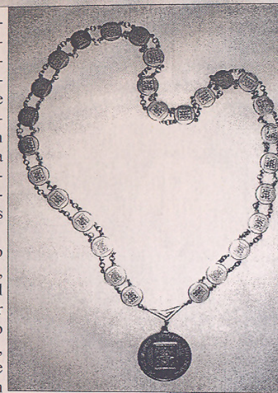
O novo colar que prende a Medalha do IHGSC

Os sócios Eméritos são uma categoria especial do IHGSC, assim denominados após 15 anos como Titulares, com trabalhos publicados sobre Santa Catarina e efetiva contribuição para a Instituição. Somente os Eméritos compõem o