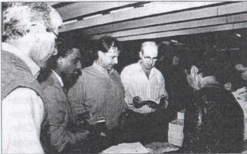
Presentes adquirindo a obra no seu lançamento