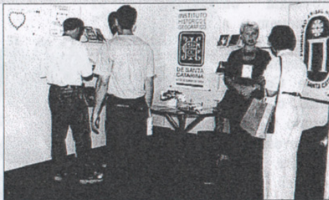
Estande do IHGSC e da Fundação Aníbal Nunes Pires, na Feira de Rua do Livro de Florianópolis

Desta vez, em associação com a Fundação Aníbal Nunes Pires, compareceu à Feira de Rua do Livro de Florianópolis, organizada pela Câmara Catarinense do Livro, que se realizou de 10 a 19 de maio, no centro da capital, divulgando sua marca com êxito, e vendendo a preços populares os livros e revistas de sua publicação e de seus associados.