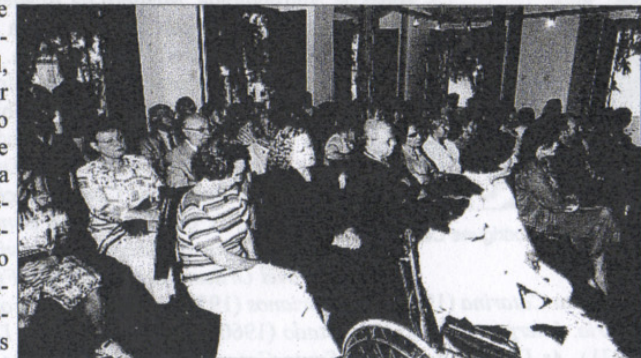
Grande público compareceu à Sessão em homenagem ao centenário de Osvaldo Cabral.