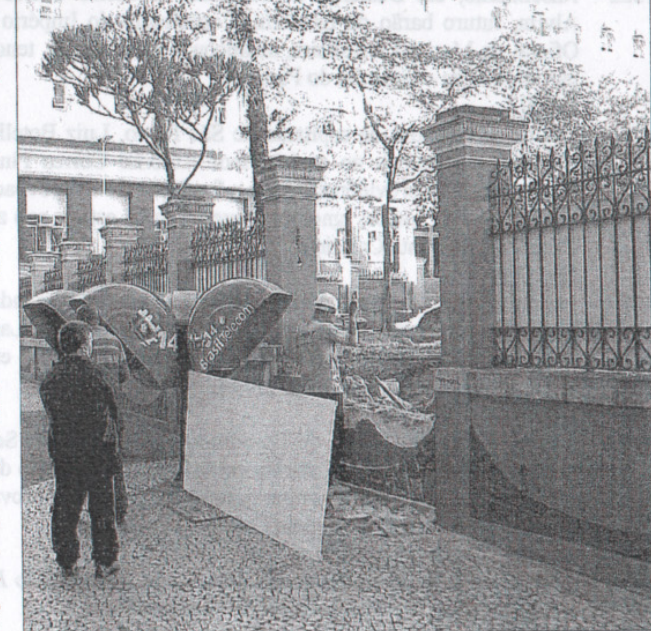
Destruição de parte do muro para abertura de nova passagem e "modernização" dos jardins do Palácio Cruz e Sousa, construído no século dezoito.

Ocorreu no dia 03 de julho a derrubada de parte do muro do Palácio Cruz e Sousa, na rua Trajano. Sede dos governos de Santa Catarina desde o período colonial até 1986, o edifício é tombado como Patrimônio Histórico Cultural catarinense e ocupado pelo Instituto Histórico e Geográfico de Santa Catarina e pelo Museu Histórico de Santa Catarina.